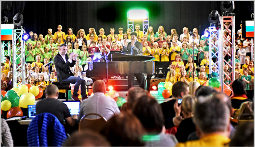
Renginys „Geltona, žalia, raudona“, skirtas Lietuvos nepriklausomybės atkūrimo 25-ečiui paminėti, įvyko 2015 m. kovo 22 d. Pasaulio lietuvių centre, Lemonte, IL. Vienas iš mecenatų – Lietuvių Fondas.

The event “Yellow, Green, Red”, dedicated to commemorate the 25th Anniversary of Restoration of Independence of Lithuania, took place on March 22, 2015 at the Lithuanian World Center, Lemont, IL. One of the Sponsors – Lithuanian Foundation.