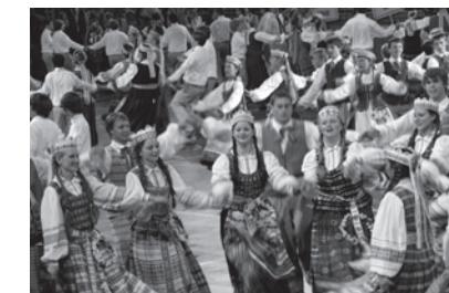
XIII Lietuvos tautinių šokių šventės Los Angeles akimirka.