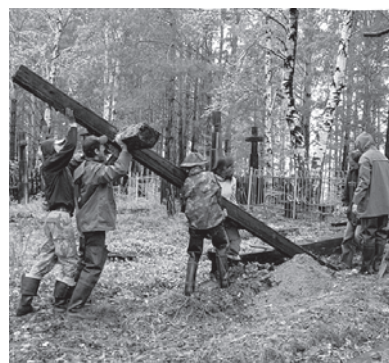
„Vien šių kryžių dydis parodo kokia maža, tačiau visgi didi tauta buvome, esame ir jaunosios kartos dėka - tikrai išliksime“.

Lithuania’s “Ateitininkai” by the monuments honoring freedom fighters.