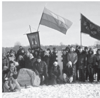
Lietuvos ateitininkai prie paminklų Laisvės kovotojams.

“Inclement weather, but our spirits are high,” write Lithuania’s Scouts as they participate in the unique self-guided tour of cultural and historical places.