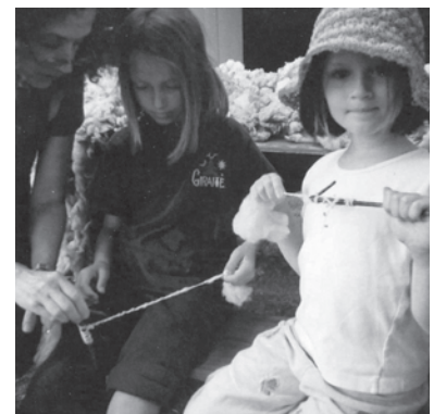
Stovyklautojos Neringoje (VT) Campers at Camp Neringa (VT)

12th World Lithuanian Youth Congress in Canada