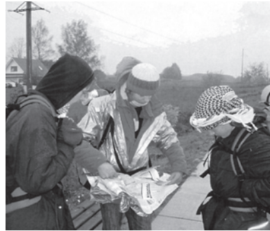
„Oras ne koks, bet nuotaika gera“-rašo Lietuvos skautai, žygio po Lietuvą metu, aplankant istorines, kultūrinės vietas.

“Inclement weather, but our spirits are high,” write Lithuania’s Scouts as they participate in the unique self-guided tour of cultural and historical places.