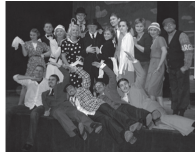
Teatro sambūrio „Žaltvykslė“ aktoriai. Actors of "Zaltvyksle" theatre troupe.