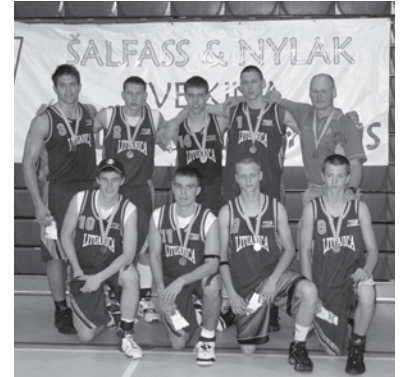
Lituanica jaunių klasės - ŠALFASS žaidynių nugalėtojai

Lituanica youth - junior division champions at the SALFASS tournament in New York.