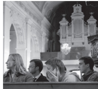
Respublikinio Jono Žuko jaunųjų vargonininkų konkurso organizatoriai dėkoja Lietuvos Fondui už skirtą finansinę paramą, džiaugdamiesi, kad su rėmėjų pagalba pavyko sėkmingai įgyvendinti šį renginį ir taip pat sumegzti nutrūkusias Lietuvos profesionalaus vargonavimo gijas.