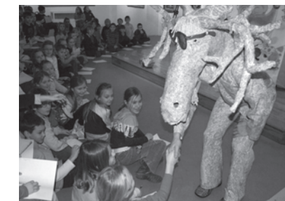
Maironio liuanistinės mokyklos (IL) mokinukai susitikime su kūrybinės grupės „GIRO“ dailininkais.