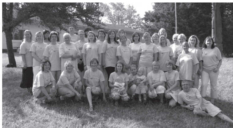
Lituanistinių mokyklų mokytojos įdomiai ir naudingai leido laiką mokytojų tobulinimosi kursuose.

Lithuanian heritage school teachers gather for a productive retreat and special conferences to improve their skills.