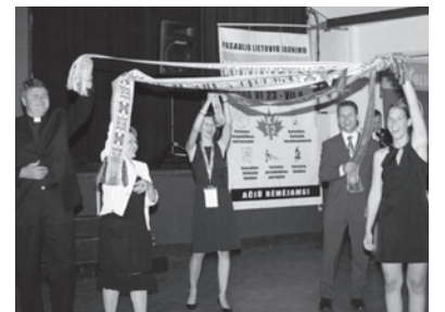
12-asis Pasaulio Lietuvių kongresas Kanadoje

Lituanica youth - junior division champions at the SALFASS tournament in New York.