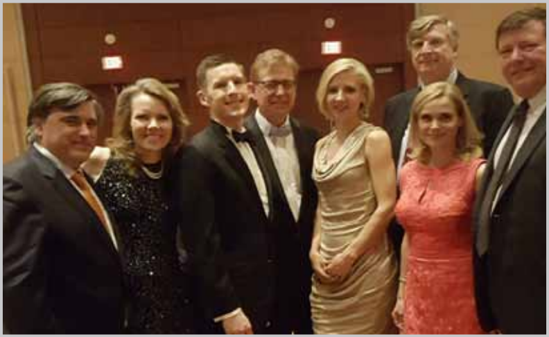
LF vadovų susitikimas su XV Šiaurės Amerikos lietuvių tautinių šokių šventės ruošėjais.

Lithuanian Foundation representatives with the organizers of the XV North American Lithuanian Folk Dance Festival.