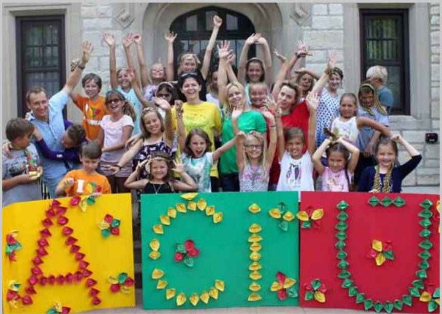
Kultūrinės menų stovyklos vaikams dalyviai, Lemont, IL.