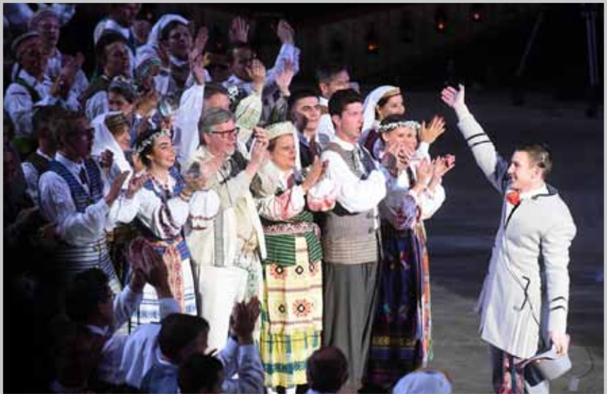
XV Šiaurės Amerikos lietuvių tautinių šokių šventė „Šaukia ten tave kelionė“. 2016 m. liepos 3 d. Baltimorė, MD.