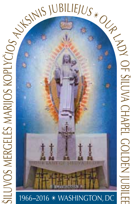
Basilica of the National Shrine of the Immaculate Conception

LRSC exhibit “Lithuanian Folk Dance Festivals in North America”.