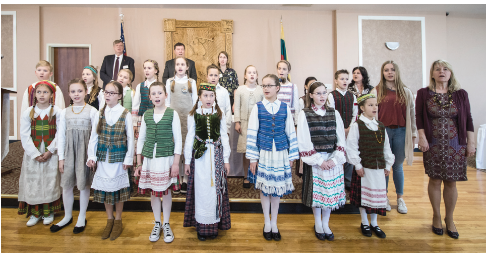
Lietuvos himną gieda Maironio lituanistinės mokyklos (Lemont, IL) ketvirtokai. The Lithuanian national anthem was sung by the fourth graders of the Maironis Lithuanian School (Lemont, IL).