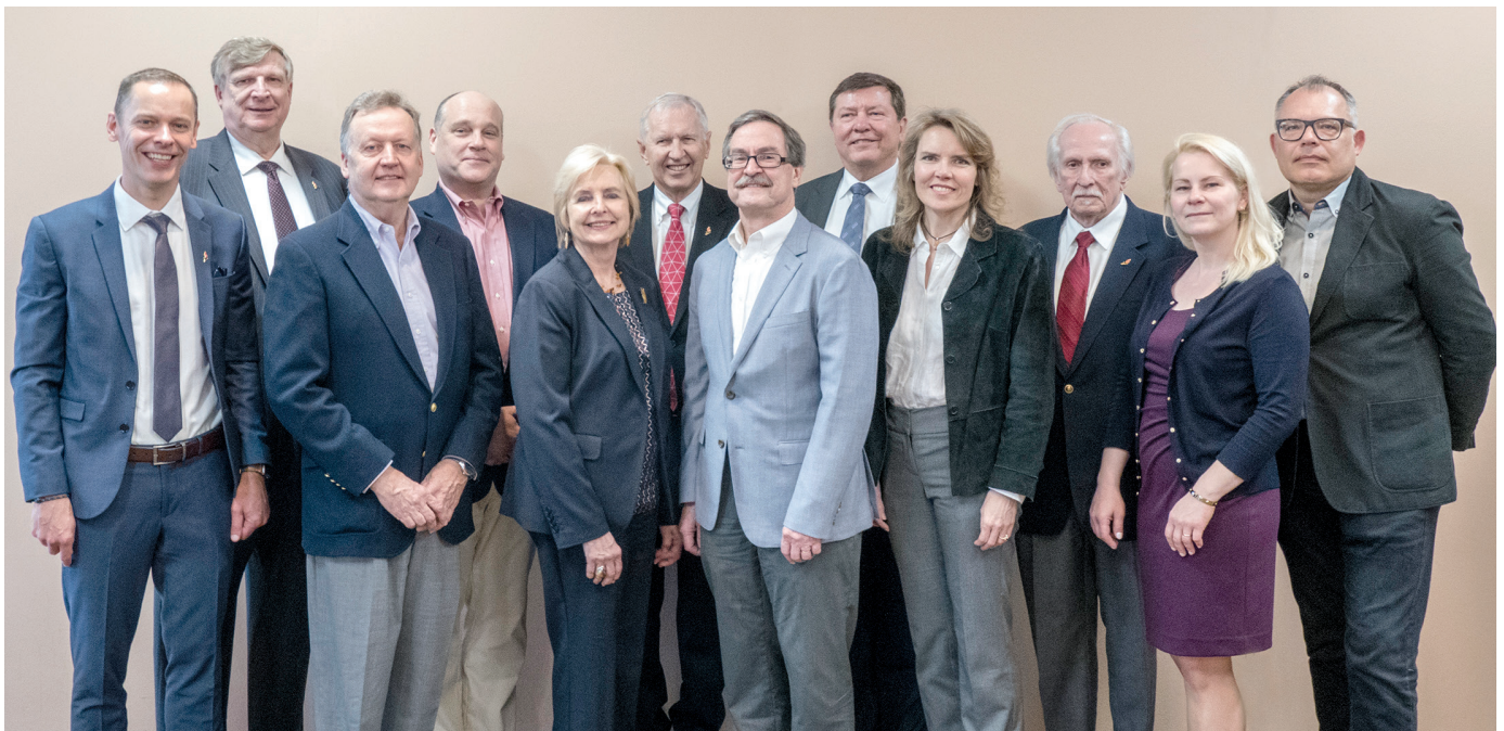
2018 m. Lietuvių Fondo taryba. LF Board of Directors, 2018.