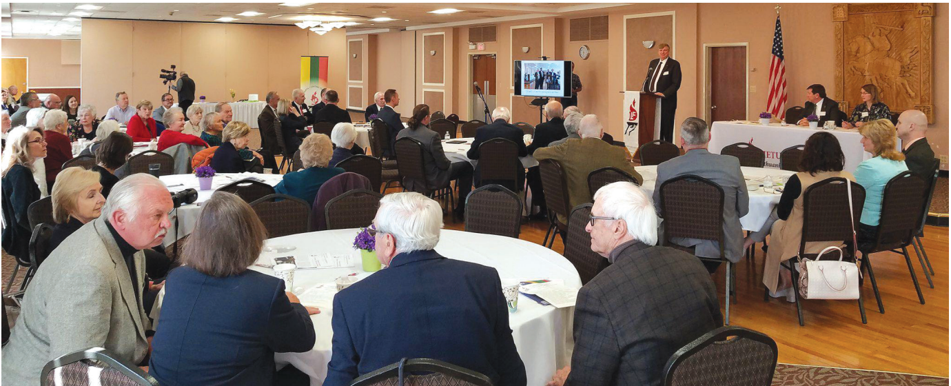
Lietuvių Fondo 55-asis metinis narių suvažiavimas. The Lithuanian Foundation's 55th Annual Members' Meeting.